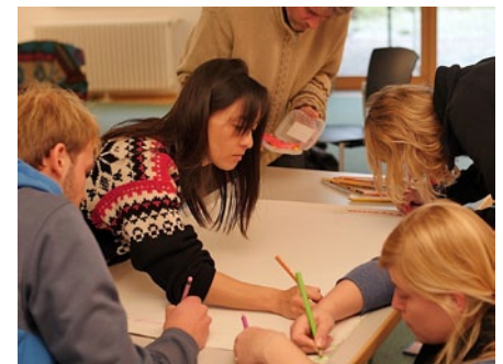
Dragon Dreaming – Traumphase