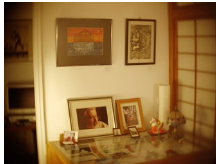
Arbeitsraum in München

des Filmteams und den Veränderungen, die es in unserem Geldsystem anstrebt: Eine Dezentralisierung von Macht, die Auflösung von Hierarchien und die Bereitschaft zum Loslassen. Die Werkzeuge basieren auf denselben Prinzipien, wie die Idee der Geldreform und ermöglichen dem Team, bereits jetzt die Veränderung zu leben, die es langfristig mit neuen Geldsystemen erfüllt sehen will.