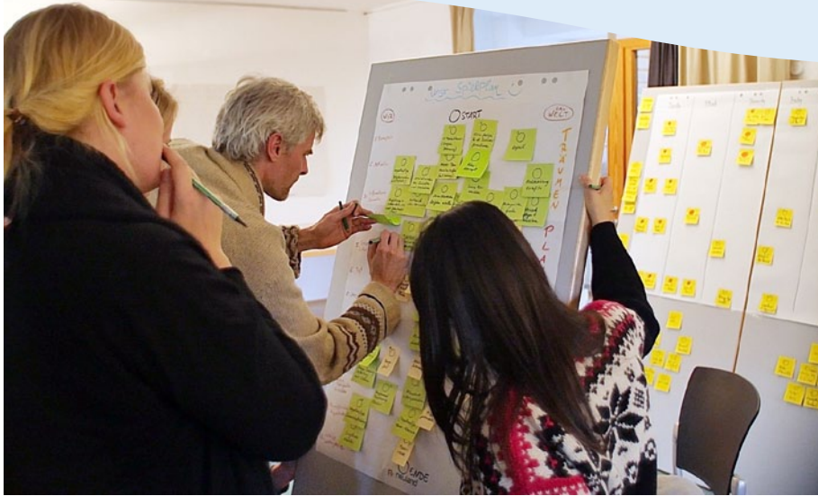
Dragon Dreaming - Visualisierung des gesamten Projektes